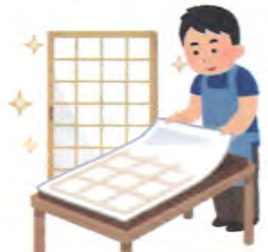
網戸、障子、襖の張り替え

皆様のお役に立ちたいとスタートした『便利屋まるなが』です。どうぞ遠慮なくお問い合わせ下さい。お見積りは無料です。