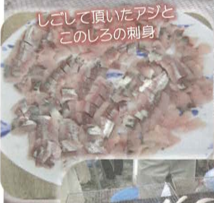
しごして頂いたアジとこのしらの刺身