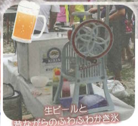
生ビールと昔ながらのふわふわかき氷