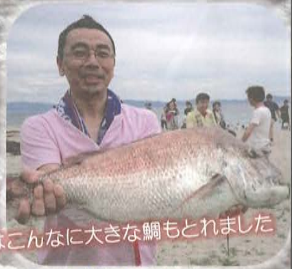
昨年はこんなに大きな鯛もとれました