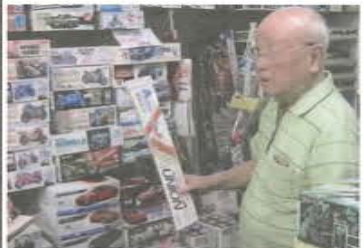
昔はこの模型から始まりました

以前は、プラモデルと言えば、戦闘機や戦艦、車、ガンダムなど男性が好むイメージが強かったのですが、最近では城や刀、妖怪ウォッチ等、女性ファンも多くなり、ミニ四駆で子供と熱きバトルをくりひろげるお母さんも急増し、子供の頃は高く買って買えなかったけど大人になった今、目を輝かせて来店され