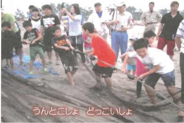
うんとこしょ どっこいしょ