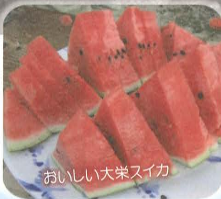
おいしい大栄スイカ