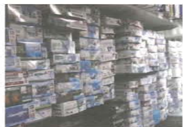
壁にギッシリ商品があります