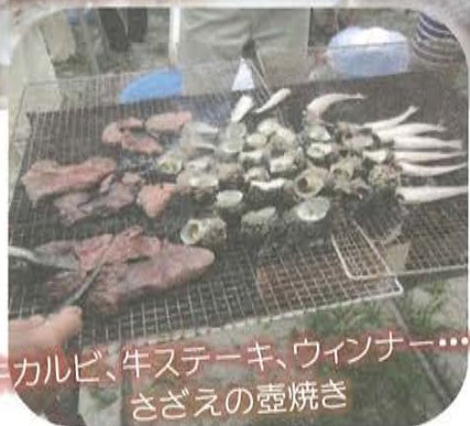
牛カルビ、牛ステーキ、ウィンナー……さざえの壺焼き