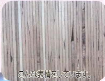
こんな表情をしています。

商品にならない材や間伐材を利用しているため、CO2の削減にも貢献する優秀なパネルです。画びょうの跡も残らず、リフォーム用の壁として最適です。ぜひご覧ください。