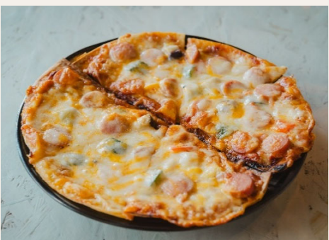
☆ミックスピザ 玉ねぎ・ウインナー・ナス・ズッキーニ・ピーマン チーズをたっぷりのせて焼きあげました。 ハーフ 700円(税込) | 枚 1,300円(税込)