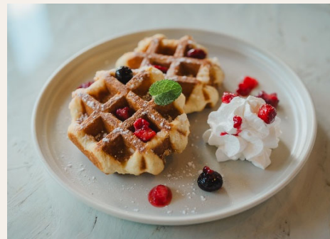
☆ベルギーワッフル サクッとした食感とやさしい甘さが特徴。 500円(税込)