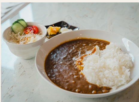
☆カレー サラダ付き カレー好きに人気のややスパイシーな味わい。 リピートする方も多数！ 800円(税込)