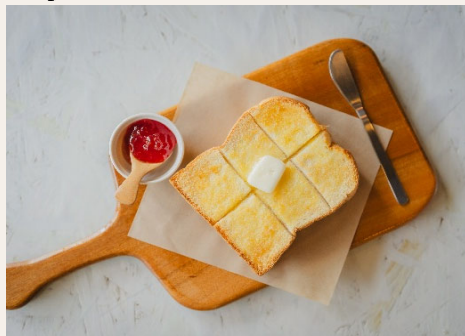
大山バターの厚切りトーストセット ジャム・ドリンク付き ドリンクは☆よりお選びください。 750円(税込)