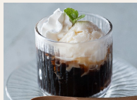
コーヒーゼリー 自家焙煎したコーヒーをゼリーにしました。 550円(税込)