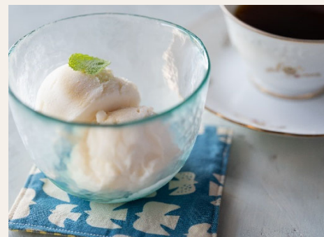
バニラアイスクリーム 地元わたなべ牧場のあっさりとしたアイスクリーム。 500円(税込)