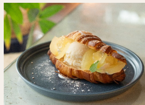
☆クロワッサンのフルーツサンド サクサクのクロワッサンに季節のフルーツと アイスクリームをサンドしました。 700円(税込)